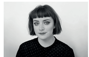
Camille Robert

978-2-89091-635-7 • 200 pages • 13 x 19 cm 22,95 $ • Également en ePub et PDF