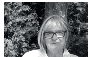
Louise Toupin