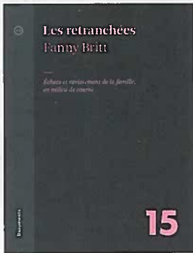
LES RETRANCHÉES, FANNY BRITT ATELIER 10, 13 €, EN LIBRAIRIE.