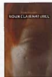
ROUX CLAIR NATUREL, FANIE DEMEULE

«C'est le livre qui m'a le plus marquée à l'adolescence, et qui est d'ailleurs à l'origine de mon roman graphique Jane, le renard et moi . On y découvre l'histoire d'une jeune orpheline qui s'émancipe grâce à son travail, à sa bienveillance et à son intelligence. Une héroïne extraordinairement féministe.»